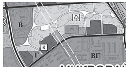
«Дубки» на проекте Генплана 2010-2020