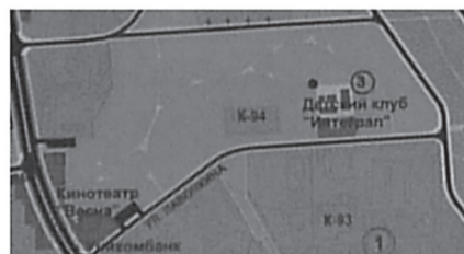
«Дубки» на Генплане 1999-2009